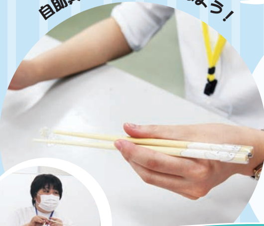
作業療法学科体験ブース