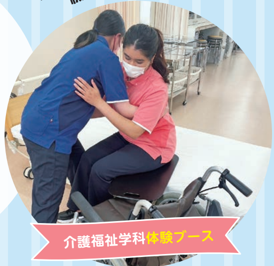
介護福祉学科体験ブース