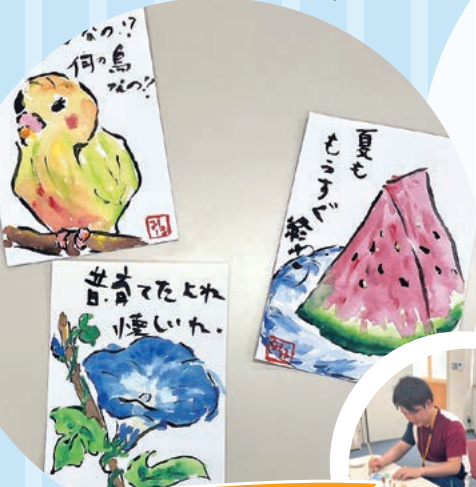
精神保健福祉学科体験ブース