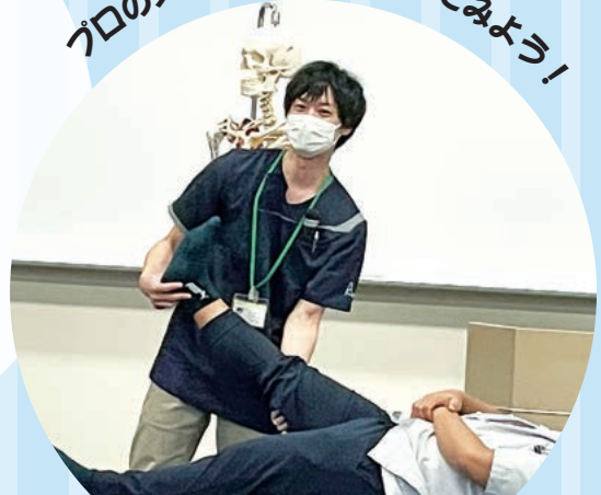
理学療法学科体験ブース